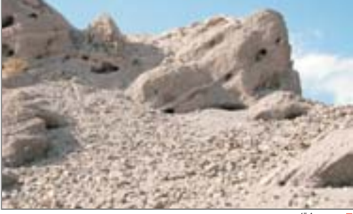
برج وسط قلعه