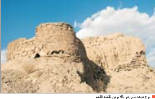
برج دیده بانی در بالاترین نقطه قلعه

در پایان اهالی روستای شمیل در خواستی از مسئولین میراث فرهنگی دارند : از مسئولین میراث فرهنگی وگردشگری استان خواهشمندیم اطلاعات جامعه تری را در مورد این قلعه در اختیار مردم بگذارند که نه تنها ما بلکه تمامی مردم اطلاعات دقیقی در مورد پیشینه وتاریخ محل زندگیشان بدانند .