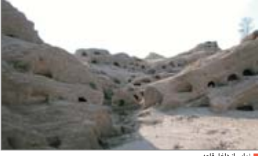
نمایی از داخل قلعه

■ چندین سال پیش گروهی که خودشان رابه عنوان نوادگان این سادات جازده بودند وبا اظهار این مطلب که با نقشه ای که ازآجدانسان به آنها رسیده این قبور را پیدا کرده اند، این سنگ ها را برای نشانه می برند.