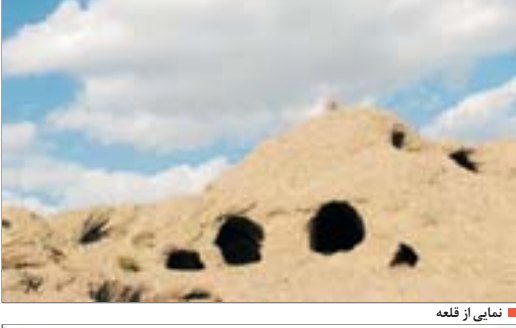
نمایی از قلعه